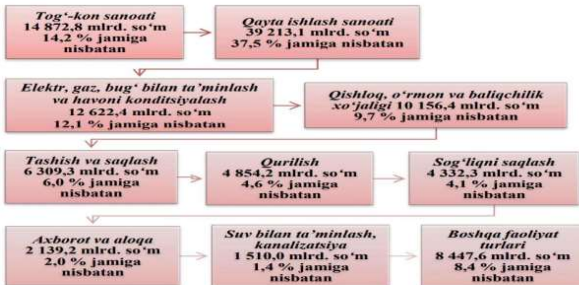
1-rasm Iqtisodiy faoliyat turlari bo'yicha xorijiy investitsiyalar va kreditlar tarkibi, % da 5

korxonalar sonining ko'payishiga imkon yaratdi. Biroq, ushbu davrgacha xorijiy investitsiya ishtirokidagikorxonalar ustav fondidagi xorijiy investitsiyalar ulushining eng kam miqdori 30 foiz qilib belgilanganligi xorijiy investitsiyalarni jalb qilish ko'lamiga salbiy ta'sir ko'rsatdi.