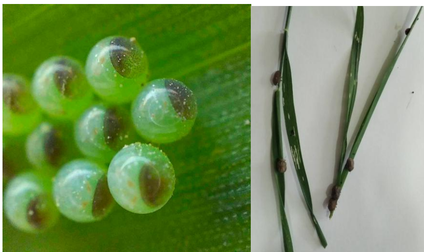
1-rasm. Termiz tumani Namuna hududida joylashgan bug'doyzorlardan olingan zararli xasva tuxumlari va imagosi.

Hemiptera — yarim qattiqqanotlilar turkumi. Zararli xasva Markaziy Osiyoda, Kavkazda, G'arbiy Yevropada va Yaqin Sharqdagi barcha mamlakatlarda tarqalgan. Voyaga yetgan xasvaning bo'yi 11—14 mm keladi. Tanasining rangi sariq yoki sarg'ishkulrang, sirti marmarsimon naqshli bo'ladi. Oldingi ko'kraginging keying yarmi oldingi yarmidan oqishroq. Qalqonining tubida ikkita oqish dog'i bor. Qalqonining qorni oxiriga yetib, yaxshi rivojlanganligi zararli xasva uchun juda xosdir. Qalqonining oxirgi uchi oval shaklda, boshining oldingi tomoni to'mtoq, boshining bo'yi eniga teng. Zararli xasvaning xususiyatlaridan biri ularning to'p bo'lib yashashidir. Bug'doy pishganda havo harorati va namlik yuqori bo'lganda xasvalar ekinlarga katta zarar yetkazadi. Masalan, O'zbekistonda xasvalar yer sathidan 2000 metrgacha baland bo'lgan joylarda o'simliklar qoldig'ida va to'kilgan burglar orasida qishlab chiqadi. Tog'oldi zonalarda to'kilgan barglar qurib, havo harorati 17°C dan oshganda, bu aprel oyining o'rtalariga to'g'ri keladi, xasvalar yana bug'doy ekilgan joylarga qaytadi.[1]