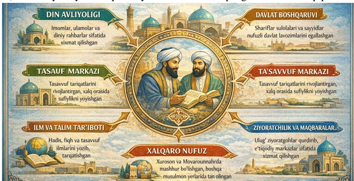
2-rasm. Termiz sayyidlarining IX-XVII asrlarda o‘rta osiyo ijtimoiy-siyosiy hayotidagi roli.

Birinchi yo‘nalishda Sulton Saodat majmuasiga doir bir qator ishonchli tavsiflar mavjud bo‘lib, ularning umumiy xulosasi muhim: majmua Termiz sayyidlari qabrlari ustida XI-XVII asrlarda bosqichma-bosqich shakllangan va turli davrlarda maqbara, masjid hamda xonaqoh kabi inshootlar bilan to‘ldirilgan. Ushbu qatlamlilik (XI-XVII) Termiz sayyidlarining kamida yarim ming yillikdan ortiq davomiy xotira va institutlashuvga ega bo‘lganini ko‘rsatadi. Ensiklopedik manbalar ham majmuani X-XVII asrlar oralig‘ida shakllangan kompleks sifatida qayd etib, Termiz sayyidlarining Payg‘ambar avlodidan ekani haqidagi mahalliy tarixiy an’anani keltiradi.