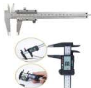
1-rasm. Texnologiya fanidan qo'llaniladigan asboblar