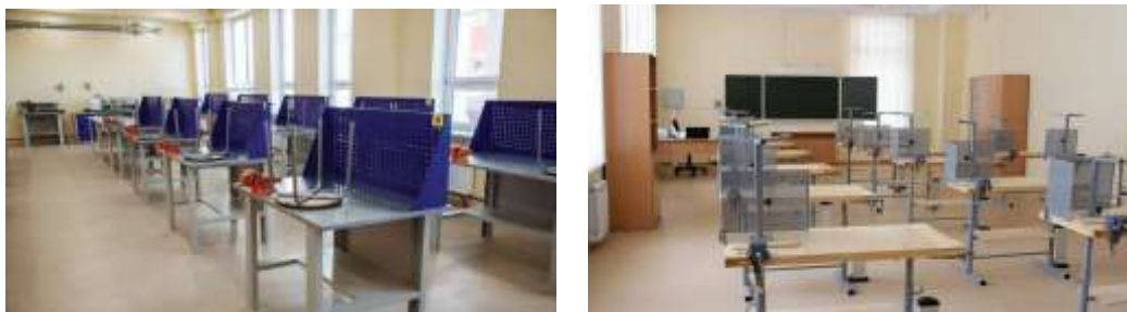
2-rasm. Texnologiya o'quv xonasining ko'rinishi

Yuqotida aytib o'tganimizdek, bugungi kunimizda texnikalarning ahamiyati va roli juda katta. Shunday ekan, bugungi kungi shart sharoitrlardan keng va unumli foydalangan holda o'quvchilardan faqat o'qish talab qilinmoqda.