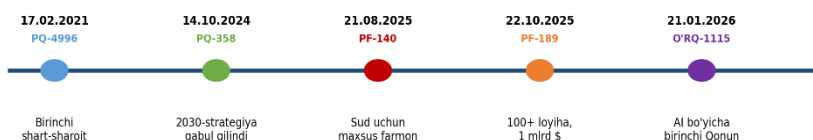
O‘zbekistonda sud tizimini raqamlashtirish bo‘yicha asosiy hujjatlar (vaqt o‘qi)