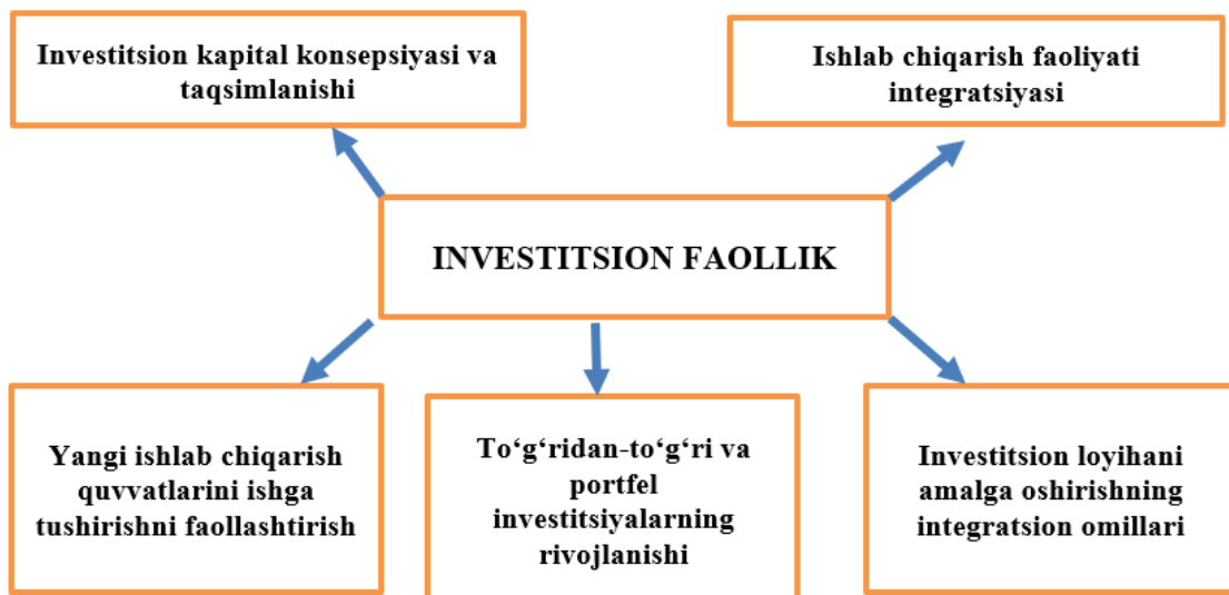
1-rasm. Investitsion faollik omillari 1

Bugungi kunda olib borilayotgan iqtisodiy tadqiqotlarda “investitsiyalar”, “investitsion faollik”, “investitsion mexanizm”, “investitsion faoliyat” va shu kabi iqtisodiy tushunchalarga yagona bir ta’rif keltirilmagan. Ko’pgina ilmiy adabiyotlarda “investitsion faollik”ka yaqin bo’lgan tushunchalar: “investitsion jozibadorlik”, “investitsion muhit” “investitsion imij” sinonim sifatida qo’llanib kelinmoqda. Bizning fikrimizcha, “investitsion faollik” mustaqil kategoriya bo’lib, xo’jalik subyektlarining barqaror moliyaviy holatini tavsiflaydi va aniq davr uchun real resurslarining safarbar etilishini anglatadi. Buni investitsion talabni qondiradigan jarayon sifatida ham talqin etish mumkin.