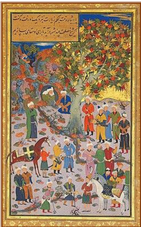
“Darvesh ziyorati” Mahmud Muzahhib imzosi bilan Sa‘diy Sheroziyning Gulistonidan nusxa.

Buxoro miniatyura maktabining asoschilaridan biri bu Mahmud Muzahhib. U Hirot maktabining buyuk vakili Kamoliddin Behzod an‘analarini davom ettirib, ularni Buxoro muhitiga moslashtirgan. Mahmud Muzahhib XVI asr boshlarida yashab ijod qilgan mashhur miniatyurachi va bezak ustasi. U dastlab Hirot (Afg‘oniston hududida) Kamoliddin Behzodning ta‘siri ostida tahsil olgan va ishlagan. Keyinchalik Buxoroga ko‘chib o‘tgan va o‘z faoliyatini shu yerda davom ettirgan. Muzahhibning asarlarida Hirot maktabining nafislik va tafsilotlarga e‘tibor berish an‘analari saqlanib qolgan. Uning miniatyuralarida insoniy his-tuyg‘ular, hayotiy voqealar va ijtimoiy sahnalar realistik tarzda tasvirlangan. Yorqin va sokin ranglar uyg‘unligi, qur‘oni karim va she‘riy asarlarning sahifalariga bag‘ishlangan bezaklar yaqqol ko‘zga tashlanadi.