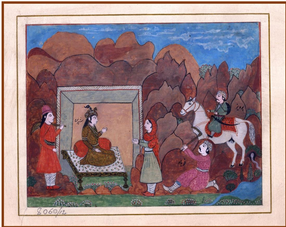
Sadridin Pochchaev "Farhod va Shirin"

Buxoro miniatyura san'atining so'nggi yirik vakillaridan biri Sadridin Pochchaev (1876–1948). Sadridin Pochchaev o'zining ijodiy faoliyati bilan Sharq miniatyura an'alarini 20-asrga muvaffaqiyatli olib o'tgan san'atkordir. Sadridin Pochchaev miniatyura san'atida o'ziga xos uslub yaratgan. U Sharq miniatyura an'alarini zamonaviy mavzular bilan boyitib, o'z asarlarida klassik Sharq she'riyoti syujetlarini Buxoro me'morchiligi bilan uyg'unlashtirgan. Uning asarlarida "Alisher Navoiy", "Yusuf va Zulaiho", "Farhod va Shirin" kabi mashhur dostonlarga ishlangan miniatyuralar mavjud. Sadridin Pochchaevning asarlari orasida "Paxta terimi", "Boy ayollar arg'amchida", "Saylov" kabi zamonaviy mavzularga bag'ishlangan miniatyuralar mavjud. Uning "Paxta terimi" asarida kollektivlashtirish davridagi mehnat jarayoni tasvirlangan bo'lib, unda erkaklar va ayollar paxta terayotgan sahna aks ettirilgan. "Saylov" asarida esa saylov jarayoni, saylovchilarning faol ishtiroki realistik tarzda ifodalangan. Sadridin Pochchaevning asarlari Buxoro tasviriy san'at muzeyida saqlanadi. Uning ijodi Buxoro miniatyura maktabining 20-asrdagi davomchisi sifatida katta ahamiyatga ega. Uning asarlari orqali Sharq miniatyura san'ati an'alarini zamonaviy ruhda davom ettirilgan. Sadridin Pochchaev Buxoro miniatyura san'atining so'nggi yirik vakillaridan biri bo'lib, o'zining ijodi orqali Sharq miniatyura an'alarini zamonaviy mavzular bilan boyitgan. Uning asarlari Buxoro madaniy merosining ajralmas qismidir.