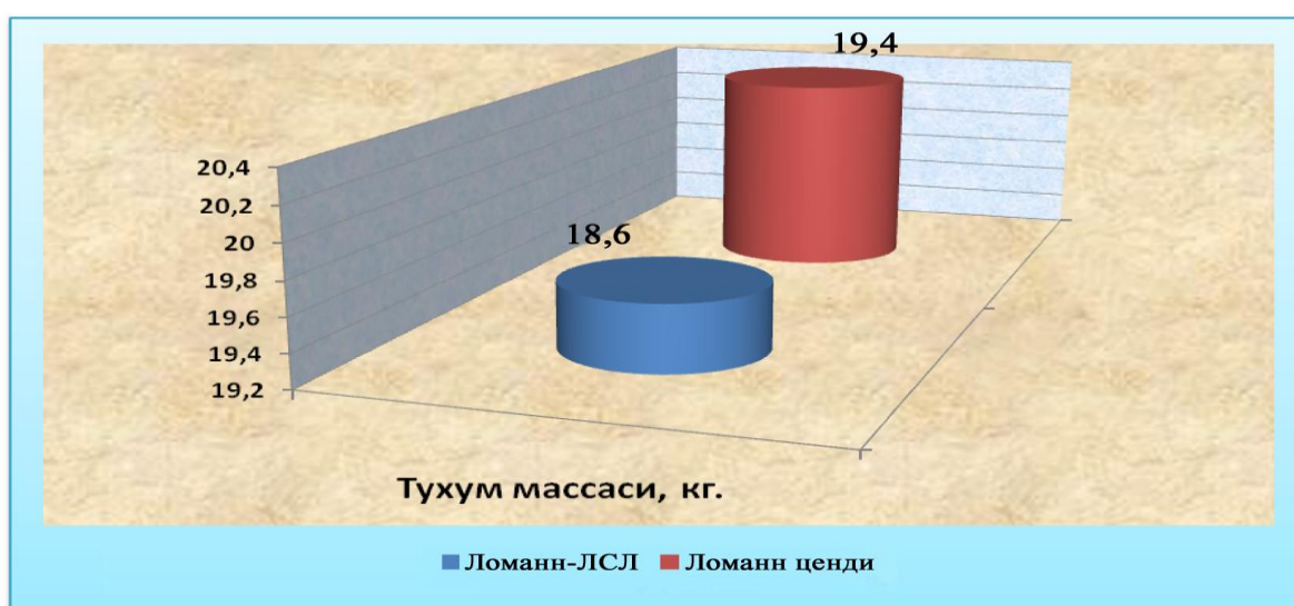
2-расм. Ўртача 1-бош товук учун тухум массаси, кг

Умумий тухум маҳсулдорлиги Lohmann-LSL кроссларига мансуб товукларда 18,6 кг ни ташкил қилган бўлса, Lohmann sandy товукларида бу кўрсаткич 19,4 кг ни ташкил қилиб, иккинчи гуруҳ товуклари 0,8 кг га устунлик қилди.