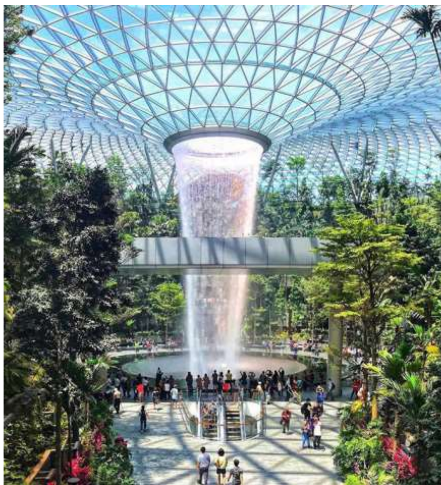
Рисунок 1. Аэропорт Чанги в Сингапуре

1. Удобство и инфраструктура аэропорта: 80% респондентов отметили, что удобство и инфраструктура аэропорта играют важную роль в их общем туристическом опыте. Современные аэропорты с развитой сетью услуг, быстрым прохождением контроля и удобной транспортной доступностью способствуют положительному впечатлению от страны или региона.