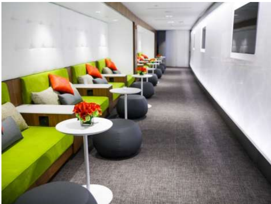
Рисунок 2. Внутренние зоны аэропортов

же регион. Аэропорты, предоставляющие больше возможностей для отдыха и развлечений, привлекают больше внимания и формируют позитивные впечатления.