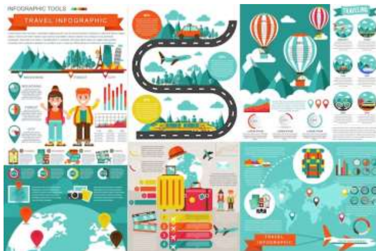
Рисунок 3. Схемы и инфографика развития туристической инфраструктуры аэропортов

4. Экономическое влияние аэропортов: Аэропорты оказывают значительное экономическое влияние на регион. Они создают рабочие места, стимулируют развитие гостиничного и туристического бизнеса, а также повышают инвестиционную привлекательность региона. Туристы чаще выбирают регионы с удобными и высокоразвитыми аэропортами, что приводит к росту туристических потоков.