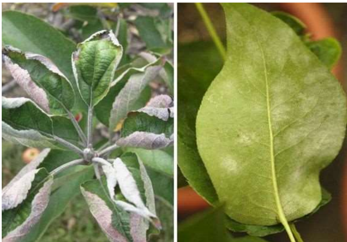
Barglarning o'zgarishiga olib keladigan kasalliklar

Endi biz mevali daraxt barglarining deformatsiyasining sabablarini ko'rib chiqamiz.