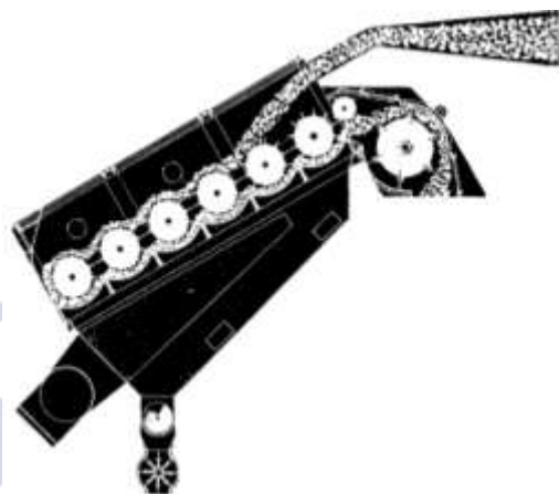
1-rasm. “Continental Eagle” korporatsiyasining 6ta qoziqchali barabanli qiya tozalagich sxemasi

Havo oqimini tezligini oshirish plastik-pishmagan tolalarni ajratishga ijobiy ta'sir etsa qayta ishlash jarayonida tolaning yo'qolishi kuzatilgan.