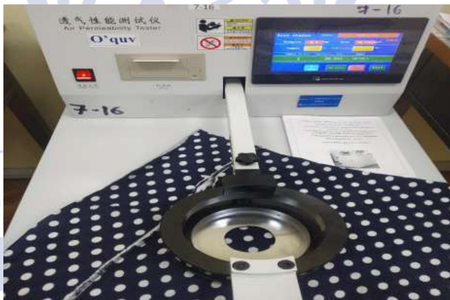
2-rasm.Suprem trikotaj matosining havo o'tkazuvchanligini tekshirish jarayoni.

Quyida A-rasmdagi jakkarq to'qimali trikotaj gazlamasi 51,62 \text{ sm}^3/\text{sm}^2\text{sek} , B - rasmdagi jakkarq to'qimali trikotaj gazlamasi 58,02 \text{ sm}^3/\text{sm}^2\text{sek} , D- rasmdagi glad to'qimali trikotaj gazlamasi 12,43 \text{ sm}^3/\text{sm}^2\text{sek} , E- rasmdagi glad to'qimali trikotaj gazlamasi 12,98 \text{ sm}^3/\text{sm}^2\text{sek} , F- rasmdagi krepshifon gazlamasi 23,870 \text{ sm}^3/\text{sm}^2\text{sek} , J- rasmdagi xol-xol suprem trikotaj gazlamasi 35,35 \text{ sm}^3/\text{sm}^2\text{sek} , K-rasmdagi suprem trikotaj matosi 26,80 \text{ sm}^3/\text{sm}^2\text{sek} havo o'tkazuvchanlik ko'rsatkichlarini tashkil etdi.Taxlil natijalaridan ko'rinib turibdiki eng yuqori havo o'tkazuvchanlik gazlama E- rasmdagi glad to'qimali trikotaj mato 12,98 \text{ sm}^3/\text{sm}^2\text{sek} -ni tashkil etdigan [8].Glad to'qimali trikotaj matosining havo o'tkazuvchanlik qolgan matolarga nisbatan yuqori natijani ko'rsatdi.Bu esa matodan tayyorlangan kiyimlarning uzoq vaqt mobaynida kiyish imkonini yaratishi mumkinligini ko'rsatib turibdi.