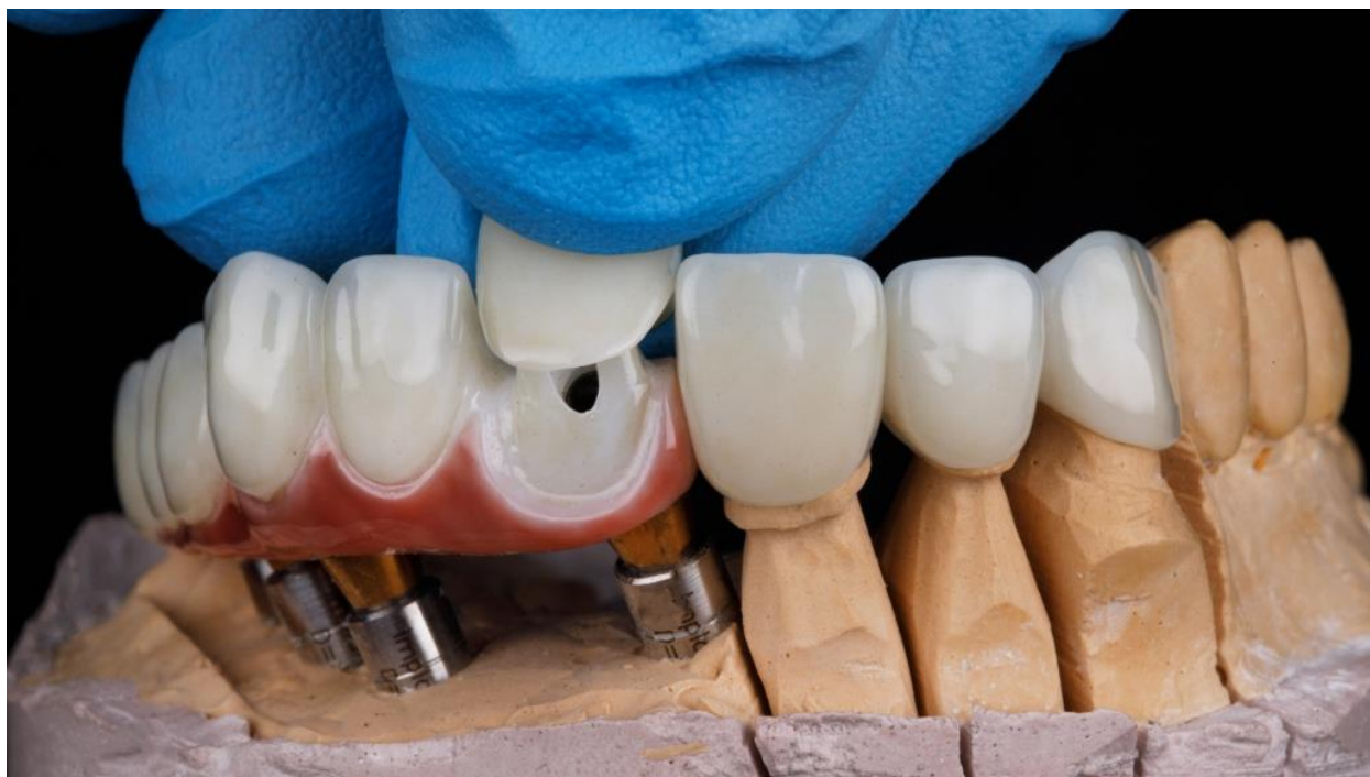
gibrid protez ko'prigida tish protezi qoplamasi