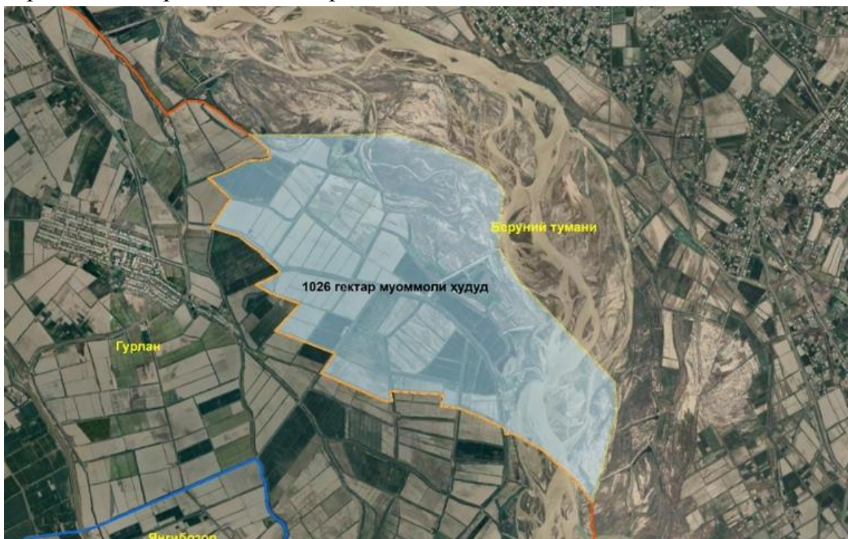
2-расм. Хоразм вилояти ва Қорақалпоiston Республикаси ўртасидаги муоммоли ҳудуд

Ҳудудлардаги иқтисодий ўсиш озиқ-овқат хавфсизлигини таъминлаш ва иш ўринларини яратиш қолаверса инвестиция оқимларини кўпайтириш ҳам ерга ва кадастр маълумотларига боғлиқ, бунинг учун энг аввало ҳудудларда ер ҳисоби толиқ олиниши зарур, мамлакатимизда баъзи турдаги кадастрлар тўлиқ шаклланмаган. Масалан, автомобиль йўллари кадастри 23%, маданий мерос объектлари 32%, қувурлар 32%, шаҳарсозлик кадастри 63% га шаклланган, холос.