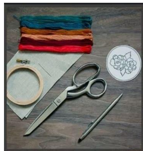
3-rasm. Kerakli asboblari

Unda o'smliksimon shakllar, naqshlar, ramziy ma'nodagi meva va hayvon tasvirlari, yozuvlar, kishilarning qiyofalari, obidalar, gul tasvirlari tushiriladi. Avvalo matoga gul, tasvir, naqsh tushirib, uni o'zining ish quroli bo'lgan chambarakka mahkamlanadi, kashta tikiladigan