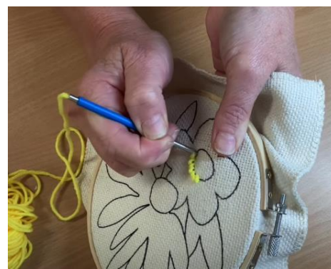
5-rasm. Kashta tikish jarayoni