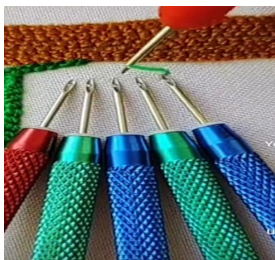
4-rasm. Maxsus igna va iplar