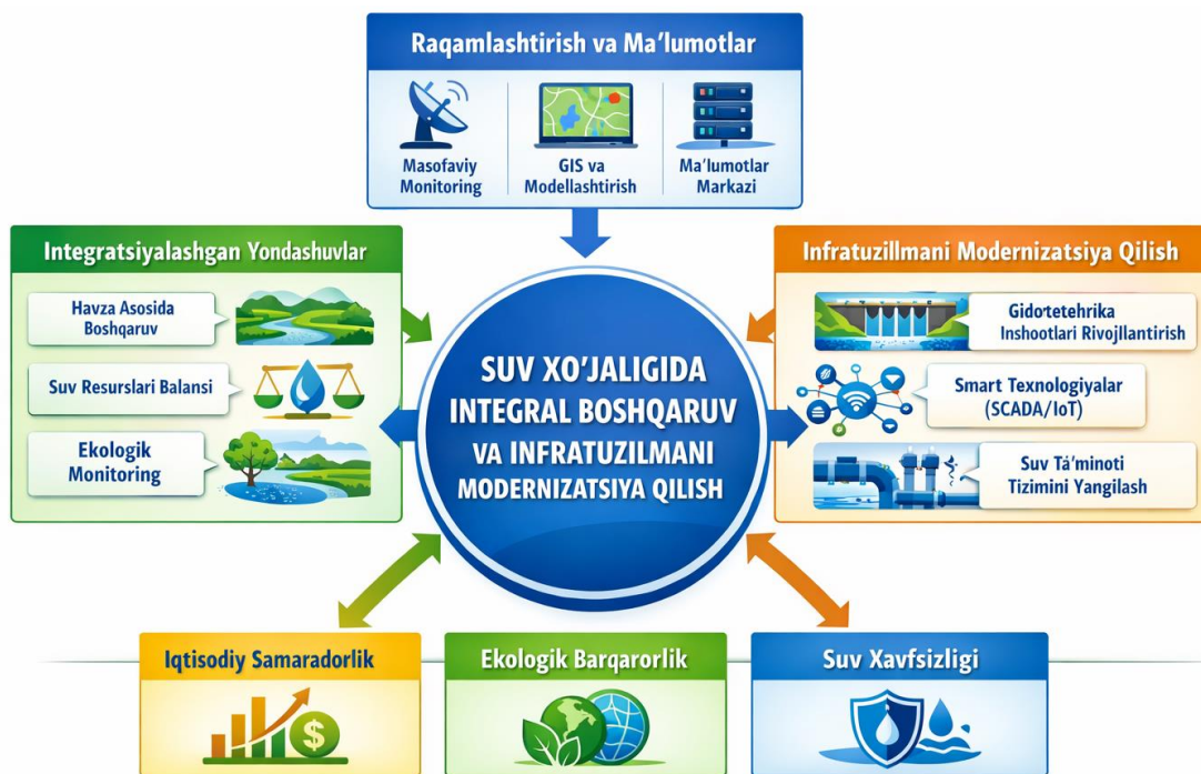
1-rasm. Suv xo‘jaligida integral boshqaruv va infratuzilmani modernizatsiya qilish