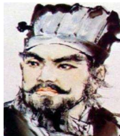
Chjan Syan (miloddan avvalgi taxminan 103)

Chjan Syan Hindistonga Birma (hozirgi Myanma) va Assom (hozirda Hindistonning alohida shtati) hamda Osiyoning janubi-sharqidagi dengizlar orqali borgan. Sayyoh bosib o'tgan mazkur yo'nalish Xitoyni Ganga vodiysi bilan