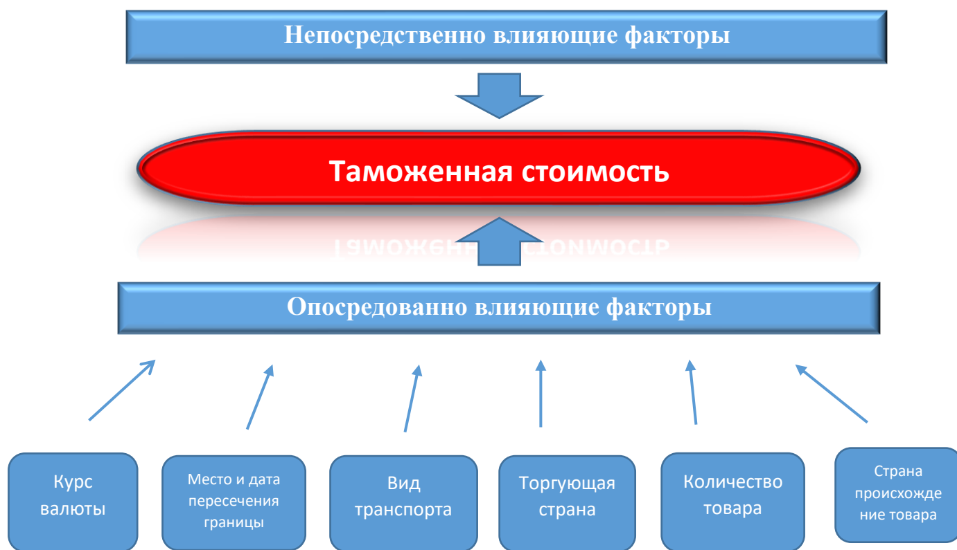
Рис.1 Факторы влияющие на таможенную стоимость 4 .

Можно выделить основные элементы, влияющие на таможенную стоимость.