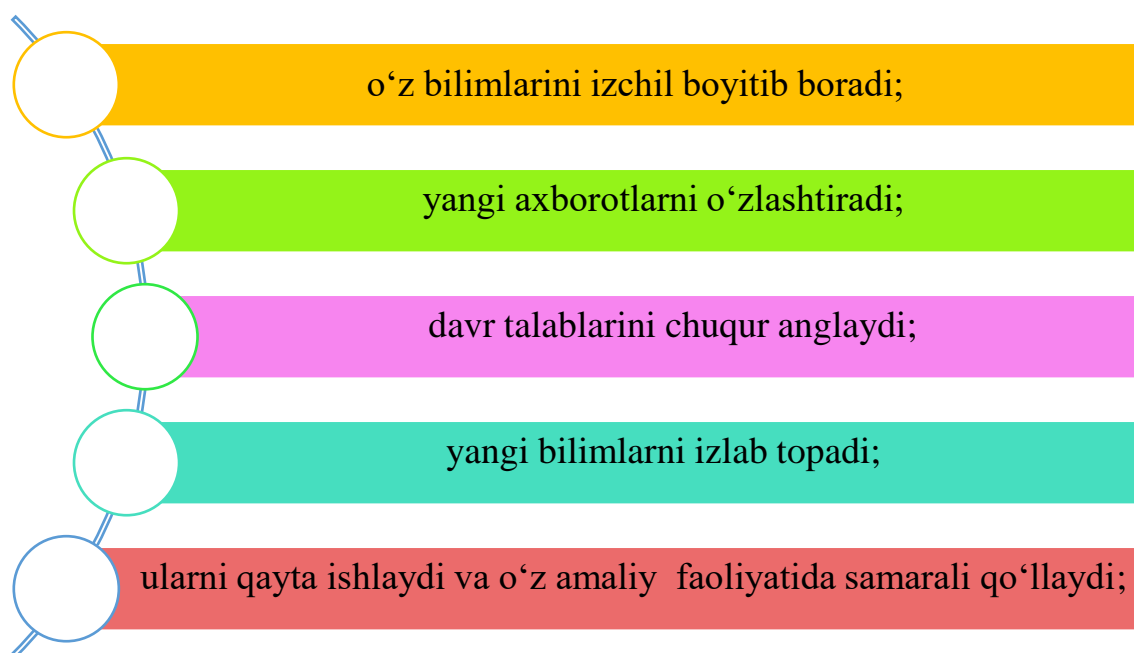
1-rasm. Kasbiy kompetensiyaga ega mutaxassisning sifatlari.

Kompetentlikka yo'naltirilgan ta'lim amerikalik tilshunos N.Xomskiy (1965 yil, Massachutes universiteti) tomonidan taklif etilgan «kompetensiya» atamasining umumiy ma'nosida shakllandi. Yevropa Kengashi dasturi bo'yicha Bern shahrida bo'lib o'tgan simpoziumda (1996 yil) «kompetensiya» tushunchasi «uquv», «kompetentlik», «qobiliyat», «mahorat» singari tushunchalar qatoriga kiritilgan. Yevropa davlatlarining ta'lim vazirlari Boloniya deklaratsiyasida (1999 yil) ta'lim islohatlarining konseptual asoslari sifatida kompetentli yondoshuv e'tirof etildi.