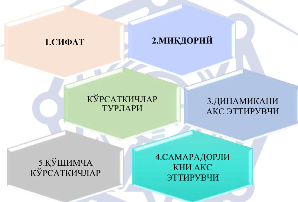
1-расм. Чегара божхона постлари орқали олиб ўтиладиган товарлар таҳлилини тавсифловчи кўрсаткичлар турлари 3

Контрабанданинг олдини олиш: олиб кирилиши ёки олиб чиқилиши таъқиқланиши мумкин бўлган товарларни, шунингдек ноқонуний фаолият учун ишлатилиши мумкин бўлган товарларни аниқлаш.