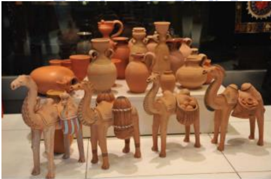
Kulol Sh.Azimov ijodi.

Kulolchilik charxi miloddan avvalgi III ming yillikning boshlarida ixtiro qilingandan keyin bu san'at turi bilan erkaklar shug'ullana boshlaganlar. Keyinchalik loydan yasalgan idish-tovoqlarni maxsus o'choq hamda xumdonlarda pishirganlar.