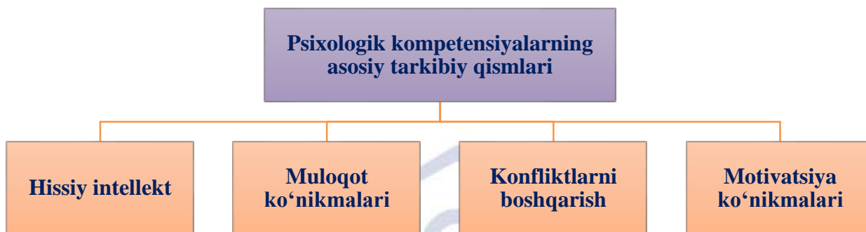
2-rasm. Umumiy oʻrta taʼlim muassasalari rahbarlaridagi psixologik kompetentlikning tarkibiy qismlari

Maktab rahbarlarining psixologik kompetentlikka egalik darajalarini belgilovchi tarkibiy qismlar quyidagicha izohlanadi: