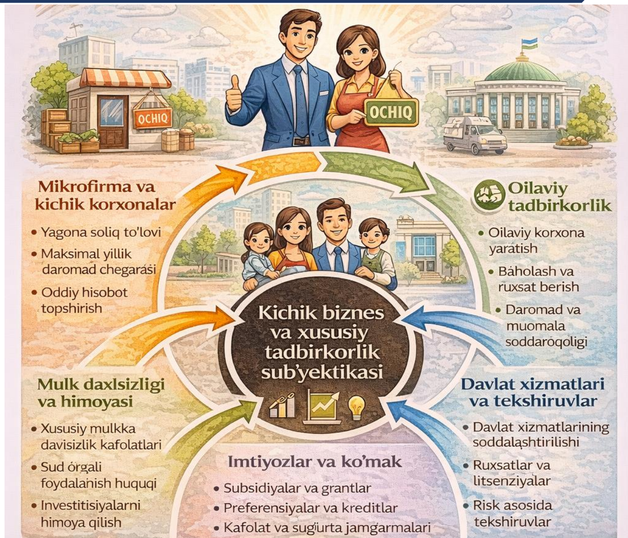
2-rasm. Kichik biznes va xususiy tadbirkorlik sub'yektikasi