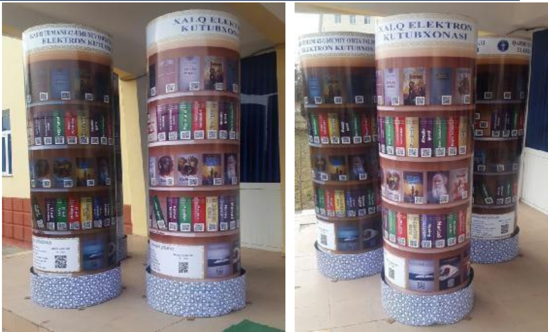
3–rasm. Tayyor QR-bookland Stendi