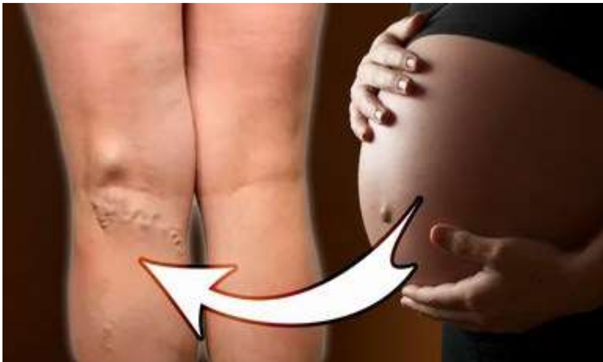
б-рисунок. Варикозное расширение вен во время беременности