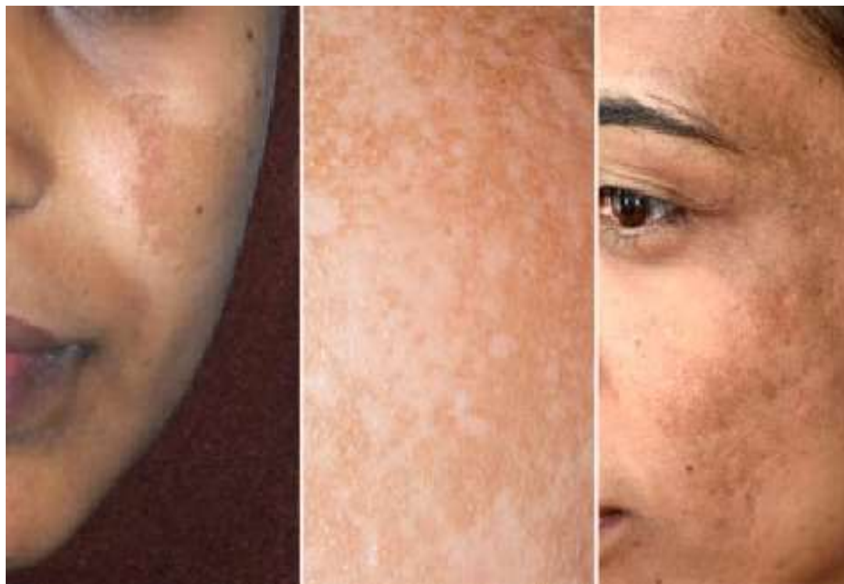
3-рисунок. Пигментация кожи у беременных

Во время беременности нельзя делать процедуры, связанные с болью и неприятными ощущениями, например чистка лица, пилинг, эпиляция и и тем более прибегать к аппаратной косметологии.